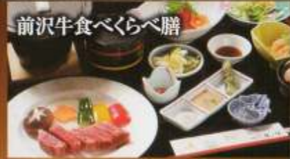
This photograph is of Steak A (sirloin). 牛排A套餐(西冷牛扒)的照片。 照片为牛排A套餐(沙朗牛排) 사진은 스테이크A (동심)입니다.

前沢牛食べくらべ膳 The Maesawa Beef Experience 「品・比・尝」前泽牛膳 前泽牛口感相较膳 마에사와규타베쿠라베膳 (소고기 맛비교요리) 5,400YEN